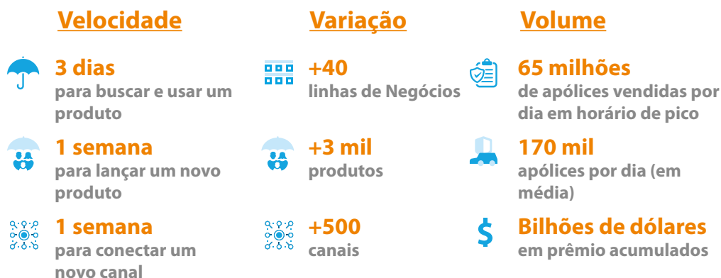
Figura 2. Status do InsureMO

O InsureMO, como um middleware do setor de seguros na nuvem, está potencializando as ofertas do eBaoCloud, bem como vários outros aplicativos. Acima estão os dados de negócios sobre o InsureMO.